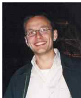
Gastautor: Dr. Marco Caliendo

Die Antwort auf die Frage „Ten Do it Better?“ lautet somit: Nein! Eine frühe rote Karte erhöht zwar die Anzahl an Toren – gut für die Zuschauer – aber sie erhöht sie zu Ungunsten der in Unterzahl spielenden Mannschaft. Das Bild ändert sich erst gegen Ende des Spiels: Von der sechzigsten Minute an verschwindet der negative Effekt einer roten Karte, d.h. erst ab diesem Zeitpunkt sollte über ein strategisches Foul nachgedacht werden, natürlich nur theoretisch!