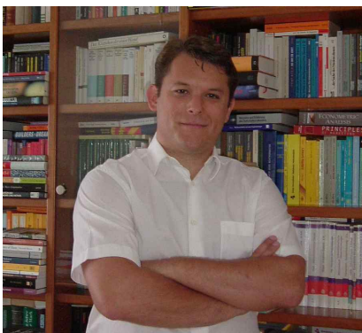
Gastautor: Dr. Dubravko Radic